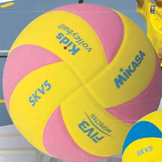
SKV5 Kids FIVB ausgezeichneter, ultra leichter Kinderball