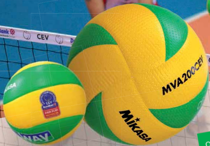
MVA 200 CEV Offizieller Spielball der Champions League

Bezug nur über den einschlägigen Fach- und Spezialversandhandel! HAMMER SPORT AG, Von-Liebig-Straße 21, D-89231 Neu-Ulm | Tel.: (0731) 974 88 -0 | www.mikasa.de