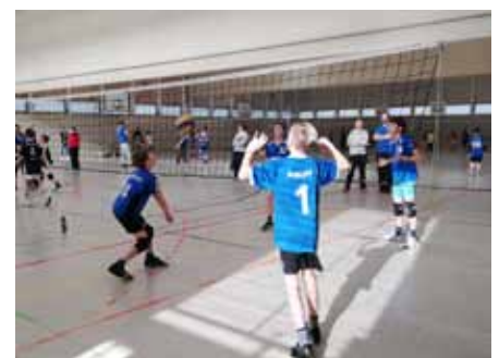
Bilder linke Seite: Bambinis. Bilder rechte Seite: Spielserie.